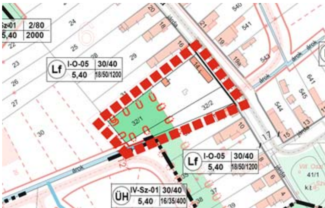
módosuló szabályozási terv részlet