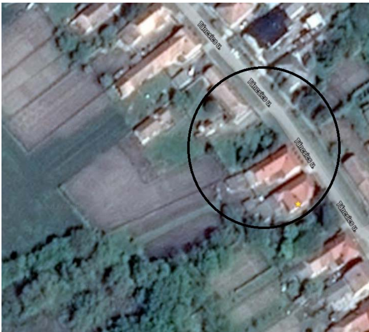
az érintett terület és környezetének légi fotója (maps.google.com)

Az ingatlan tulajdonosa a HÉSZ-ben előírt 5,0 m-es előkert nélkül, közvetlen az utcai telekhatárról indulóan, a telek oldalhatárára merőlegesen kezdte el építeni a családházát. A módosítás egyik célja, hogy a Tánicsics M. utca ezen oldalán a kialakult állapotnak megfelelően az építési hely utcai oldala előkert nélkül az utca frontra kerülhessen. A kialakult helyzetnek megfelelően a földhivatali nyilvántartásnak megfelelően – a funkcióját veszített analitikus nyilvántartás szerinti vizes árok építési területként a telek részét képezze.